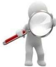
Tipos de Solicitudes